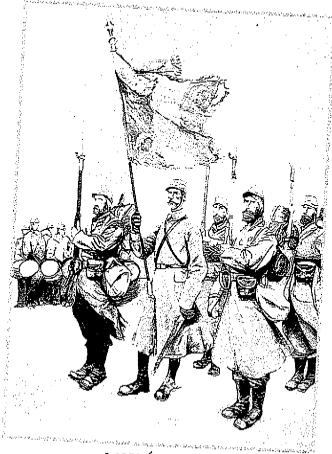
MUSÉE DE L'ARMISTICE

Vous savez pourquoi on les appelle les Poilus ?