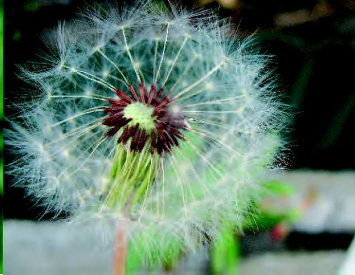
Akènes du pissenlit