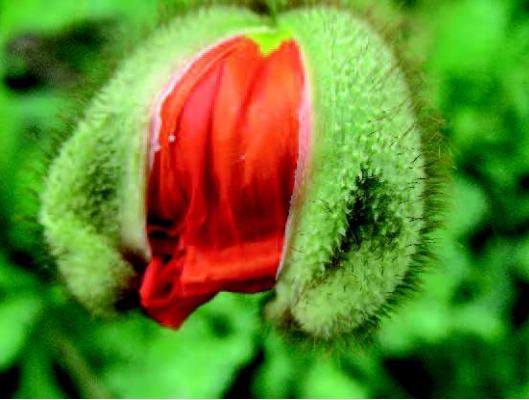
Un coquelicot va s'ouvrir